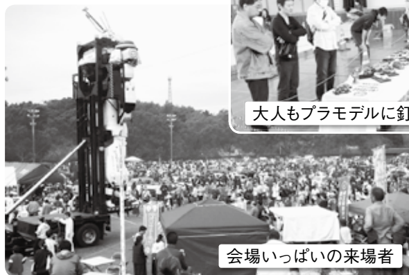
会場いっぱいの来場者