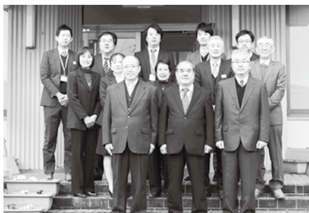
今年もよろしくお願ひします。

今年も、商工会は「行きます聞きます提案します」をモットーに役員一体となって活動してまいりますので、どうかさらなるご指導ご協力をよろしくお願ひいたします。