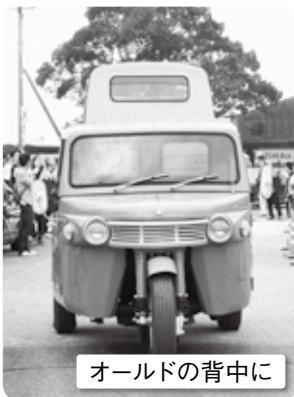
オールドの背中に

これからも、各方面からのご支援やご協力をいただきながら、時代の推移とともに愛されるイベントとして成長し続けるよう願っています。