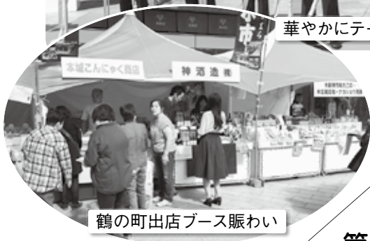
鶴の町出店ブース賑わい