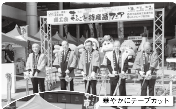
華やかにテープカット

鹿児島中央駅アミュプラザ前広場にて、鹿児島県商工会連合会北薩地区の商工会が、9月30日から10月2日までの3日間、それぞれ地元の特産品を持ち寄り展示販売を行いました。鶴の町商工会からは、新鮮市場たこの、神酒造、本城こんにゃく店が参加しました。来場者の中には旅行中の方も多く、常温保存でコンパクトな品をお土産にまとめて買われる場面もありました。今後もさらに出店を呼びかけ、地元特産品の情報発信に活用していきたいものです。