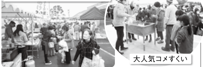
大人気コメすくい

12月4日(日)、野田農産加工施設とその周辺駐車場を会場とし、地元の農産物や農産加工品が展示販売されました。