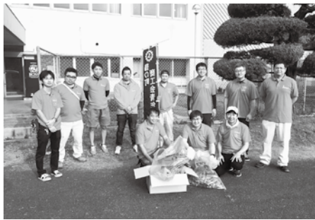
「商工会の日」清掃活動

また青年部一部のメンバーと市職員で「イズミライブプロジェクト」を立ち上げ、高尾野・野田のご当地ヒーロー「侍剣士タカオノダー」と、出水市のご