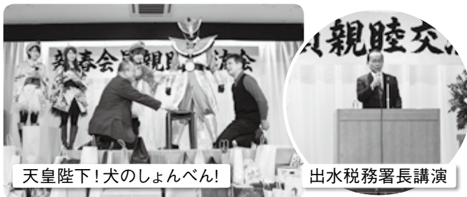
天皇陛下!犬のしょんべん!