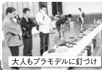
大人もプラモデルに釘づけ