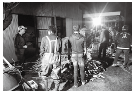
マチテラス準備作業

当地ヒーロー「三超天聖イズミライ」が誕生しました。鹿児島県のご当地ヒーロー「薩摩剣士隼人」とのコラボや各イベントへの出演など精力的に活動しております。高尾野・野田地区を盛り上げるため、どこへでも駆