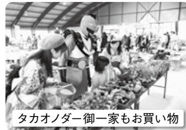
タカオノダー御一家もお買い物

12月28日(木)、高尾野きらめきドームで第21回あったか歳末特産品まつりが開催されました。正月に向け門松や花のアレンジメント、飾り餅や年越しそば、そして果物や野菜の青果物など盛りだくさんの商品、さらに恒例となっている手打ちそばやぜんざいの振る舞いなど。